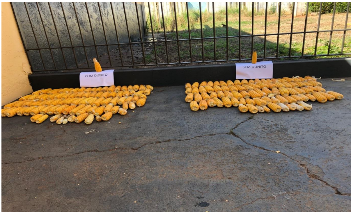
Figura 03. Ilustração das espigas sem palha no ponto de silagem. Jaboticabal – SP, 2019.