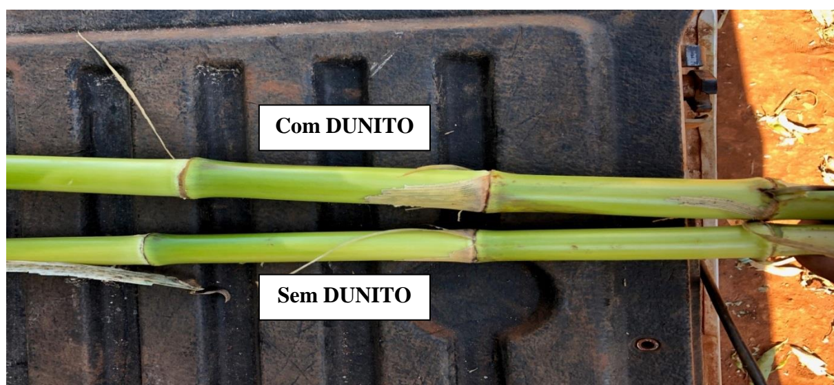
Figura 01. Ilustração representativa do diâmetro médio dos colmos de plantas adubadas com e sem Dunito. Jaboticabal, 2019.

Já para o DM a diferença foi visual, com maiores valores para as plantas adubadas com Dunito®. Além disso, estas plantas apresentavam internódios mais curtos e maior ramificação, característica que pode ser observada na Figura 01.